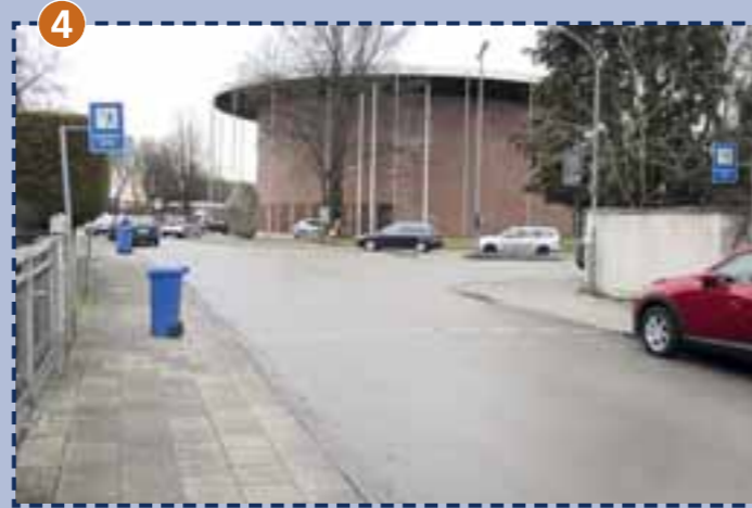
Verkehrshelferübergang Gotthelf-/Stuntzstraße Durch Schulweghelfer gesichert.