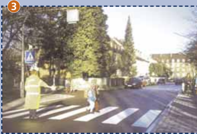
Fußgängerüberweg Stuntzstraße Durch Schulweghelfer gesichert.